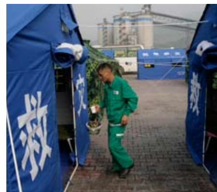
Ciment • Chine • Cimenterie de Dujiangyan après le tremblement de terre du 12 mai 2008 dans la province du Sichuan, hébergement des réfugiés

Une véritable solidarité à l'échelle du Groupe s'est mise en place rapidement, par le biais d'une collecte auprès des collaborateurs du groupe. « Cette catastrophe a resserré les liens entre les différents managers et renforcé