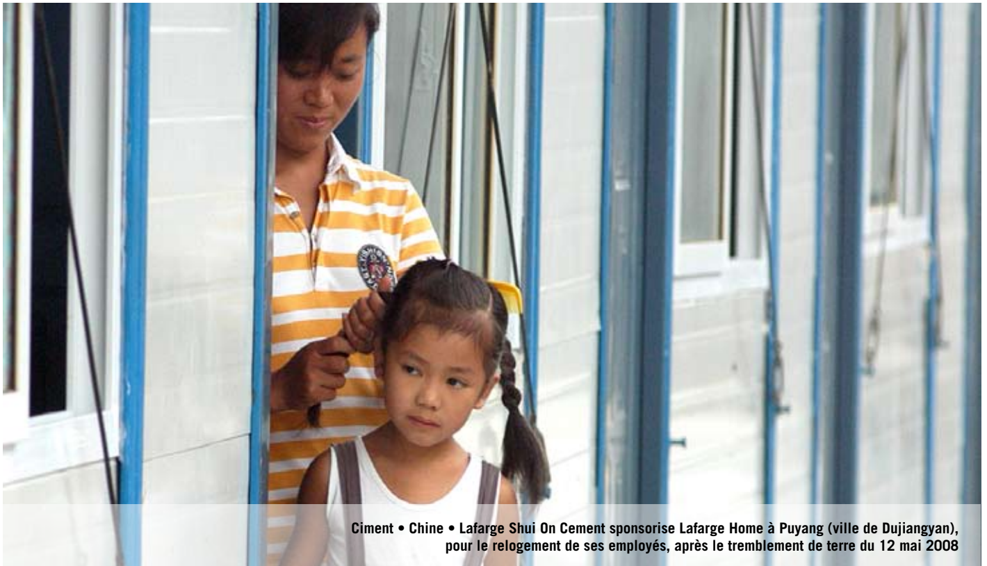
Ciment • Chine • Lafarge Shui On Cement sponsorise Lafarge Home à Puyang (ville de Dujiangyan), pour le relogement de ses employés, après le tremblement de terre du 12 mai 2008