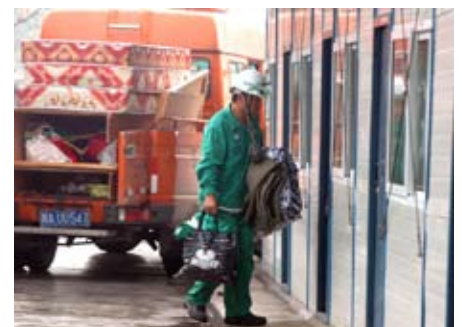
Ciment • Chine • Lafarge Shui On Cement

Six mois après le tremblement de terre qui l'a secouée dramatiquement, la région du Sichuan se relève et se reconstruit. Et cela notamment grâce à la mobilisation et à l'implication de toute une population, à laquelle Lafarge apporte quotidiennement son soutien.