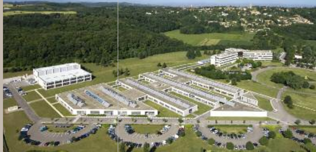
LE PÔLE TECHNOLOGIQUE Vue aérienne du Pôle technologique Lafarge, près de Lyon, France.

Chercheurs, ingénieurs, experts, techniciens, ce sont plus de 500 collaborateurs de 20 nationalités qui travaillent au Pôle technologique Lafarge. Installé près de Lyon (France) depuis 1990, le site attire près de 20 000 visiteurs par an dans les 25 000 m 2 de ses bâtiments.