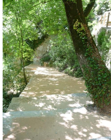
La chaux Tradifarge® Plus utilisée à Uzes

Malaxées avec du sable concassé, ces applications nécessitent peu d'entretien et sont adaptées tant pour des applications de travaux publics (pistes cyclables, chemins de golf, campings) que pour un usage privé (cours intérieures, allées de jardin, terrains de pétanque).