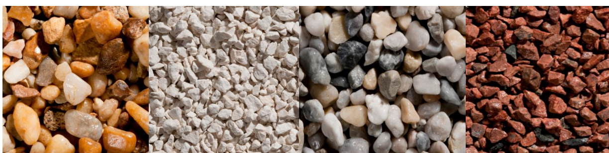
ARTEROC® Miel en Aquitaine

Lancée en février dernier, cette gamme permet de valoriser les aménagements extérieurs, tout en respectant le caractère original du patrimoine de chaque région. Convenant aussi bien à des aménagements publics que privés, la gamme Arteroc®, issue de matériaux nobles et naturels très qualitatifs, est disponible en 4 coloris différents et se décline en une grande diversité de teintes et de granulométries en fonction des régions, et de leurs gisements locaux.