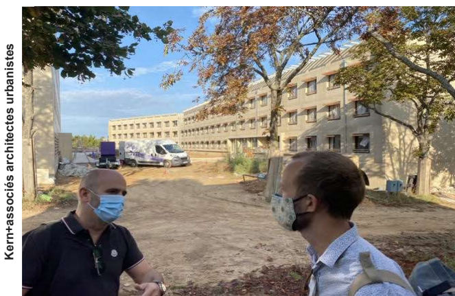
Kern&associés architectes urbanistes