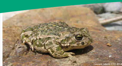
Laurent Lebois © CC-BY-A

comprend 41 carrières réparties à la fois en Vallée de Seine et en Bourgogne . Les granulats extraits sont issus de gisements de l'ère Tertiaire mais aussi de roches massives dans le secteur Bourgogne Auvergne.